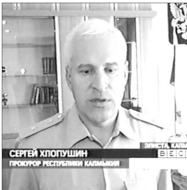
СЕРГЕЙ ХЛОПУШИН ПРОКУРОР РЕСПУБЛИКИ КАЛМЫКИИ