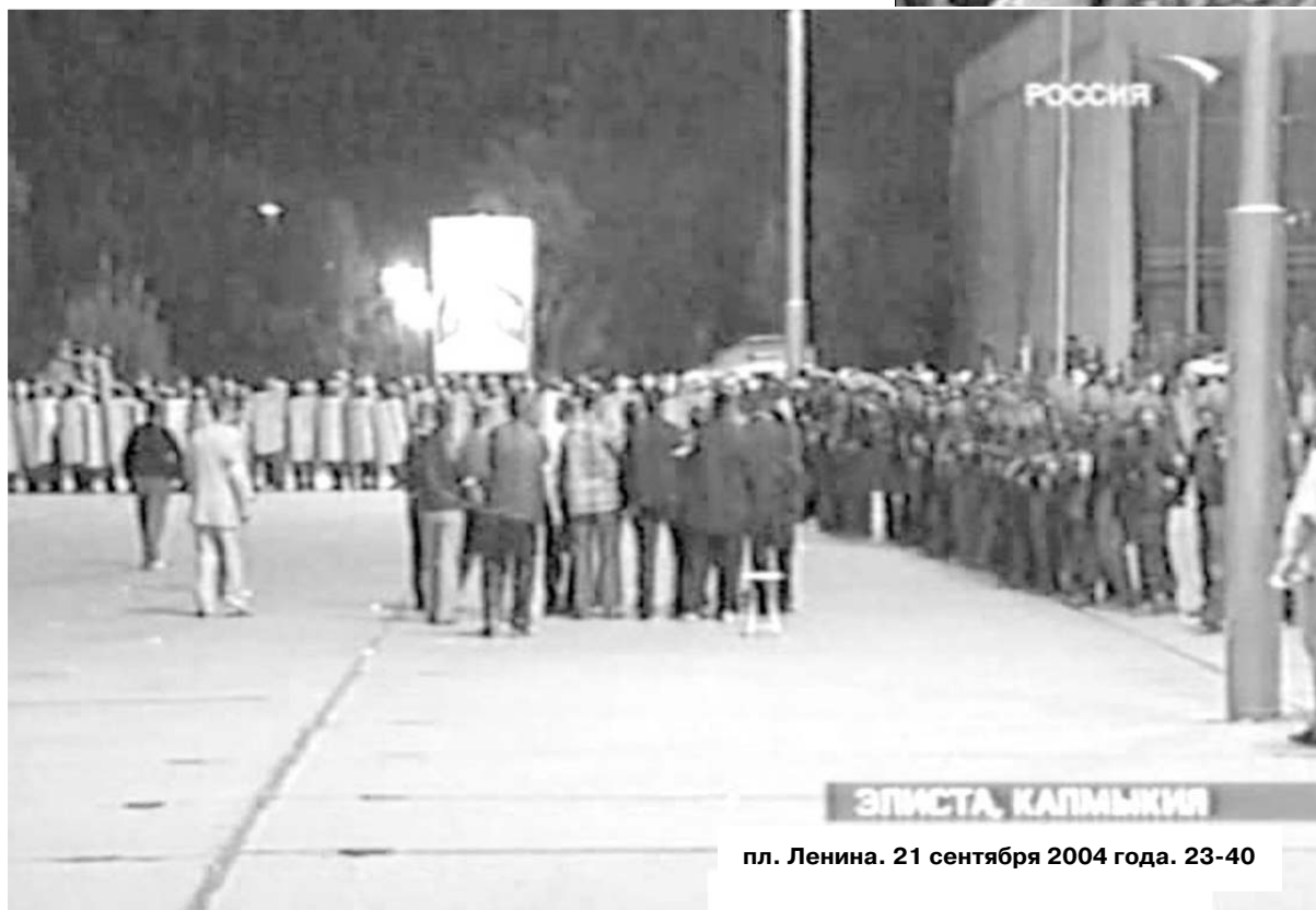
пл. Ленина. 21 сентября 2004 года. 23-40

избиения мирных граждан войсками ОМОНа России в городе Элисте в ночь с 21 на 22 сентября 2004 г.