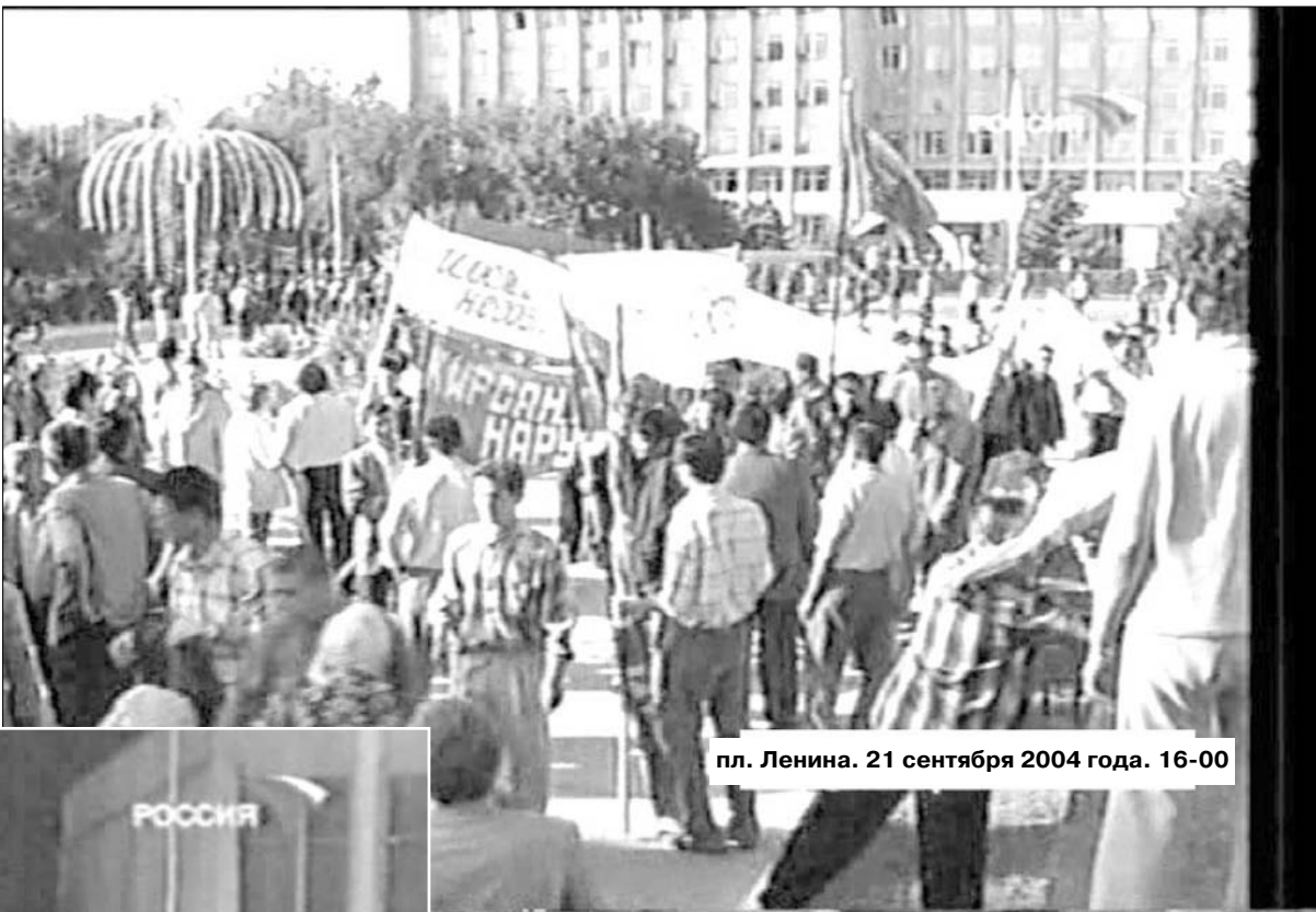
пл. Ленина. 21 сентября 2004 года. 16-00