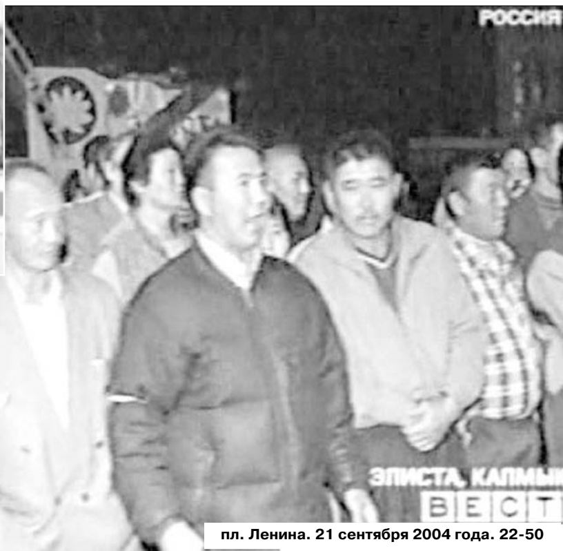
пл. Ленина. 21 сентября 2004 года. 22-50