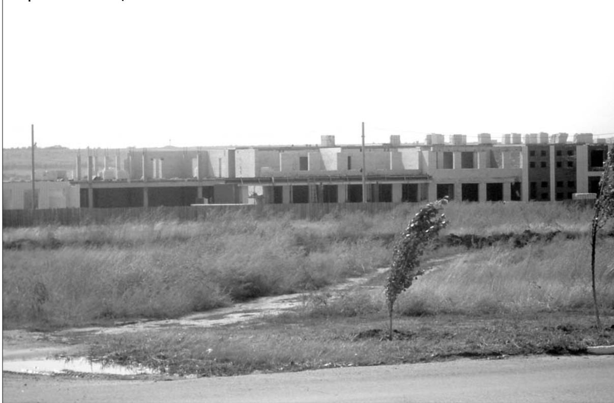
Строительство Нац. гимназии