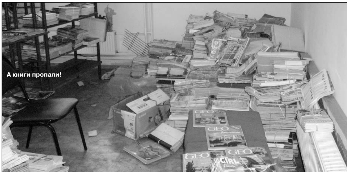
А книги пропали!

Оказалось что майские дожди "вскрыли" строительный брак. Дал небольшую течь стеклянный потол-ок, в отдельных местах промокли стены и витражи, но самое большое огорчение принесли недоделки в подвальном помещении нового кор-