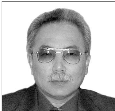
Там скалистые горы, Мир объят тишиной, Где развеется горе Рядом с доброй душой